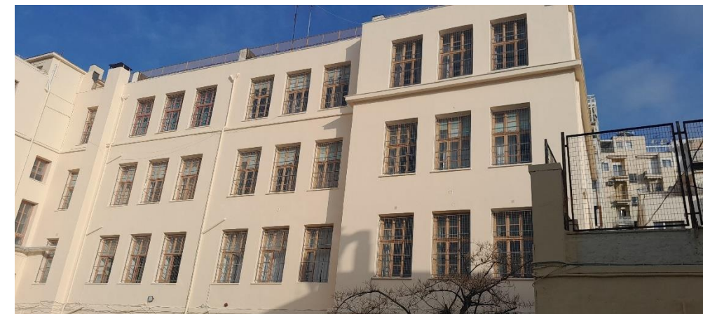
Ειδικά πλέγματα τοποθετήθηκαν σε όλα τα παράθυρα για την προστασία μαθητών και εκπαιδευτικών

Κηδεμόνων της σχολικής μας κοινότητας κινητοποιήθηκαν άμεσα και σε συνεργασία με τον Δήμο και τις αρμόδιες υπηρεσίες φρόντισαν για την άμεση αποκατάσταση των ζημιών. Μετά από δύο εβδομάδες εντατικών εργασιών αποκατάστασης το ανακαινισμένο Μαράσλειο άνοιξε ξανά τις πόρτες του στους μικρούς μαθητές, οι οποίοι επέστρεψαν με ασφάλεια στις αίθουσες διδασκαλίας για να συνεχίσουν τα μαθήματα στον φυσικό τους χώρο.