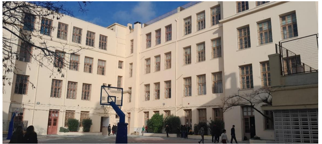
Άποψη του ανακαινισμένου κτηρίου του σχολείου μας

Τις τελευταίες εβδομάδες μαθητές, εκπαιδευτικοί και γονείς της σχολικής μας κοινότητας ζήσαμε μια δύσκολη και πρωτόγνωρη κατάσταση. Η ξαφνική πτώση οικοδομικών υλικών στο προαύλιο του σχολείου μας οδήγησε στην αναστολή της λειτουργίας του προκειμένου να αποκατασταθούν οι ζημιές που είχαν προκληθεί. Από την Τρίτη 27 Φεβρουαρίου μέχρι την Παρασκευή 8 Μαρτίου το σχολείο παρέμεινε κλειστό και τα μαθήματα έγιναν εξ αποστάσεως. Τόσο η Διεύθυνση όσο και ο Σύλλογος Γονέων και