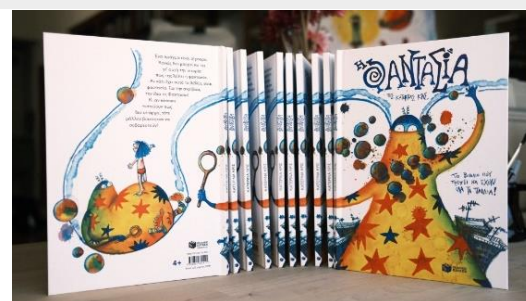
Το βιβλίο "Φαντασία"

Τη Δευτέρα 19 Φεβρουαρίου οι μαθητές της Α' τάξης μαζί με μαθητές του 10 ου Ειδικού Σχολείου συμμετείχαν σε δραματοποιημένο θεατρικό παιχνίδι, βασισμένο στο βιβλίο της Κατερίνας Κρις «Φαντασία», από την ομάδα Πάροδος. Η δράση έγινε στον χώρο της σχολικής βιβλιοθήκης.