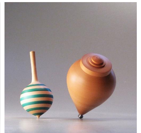
Στρόμβος ή σβούρα