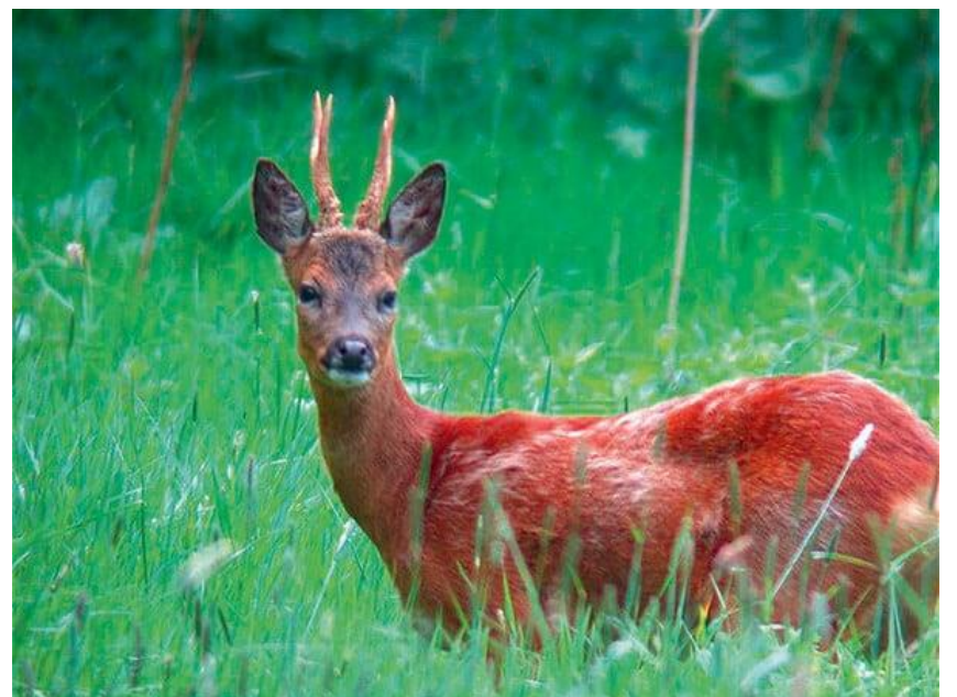
Το κόκκινο ελάφι είναι το μεγαλύτερο θηλαστικό ζώο της Ελλάδας και δυστυχώς απειλείται με εξαφάνιση

Το παράνομο κυνήγι είναι η βασική του απειλή, καθώς επίσης και οι πυρκαγιές και η μείωση των οικότοπων του εξαιτίας του ανθρώπου.