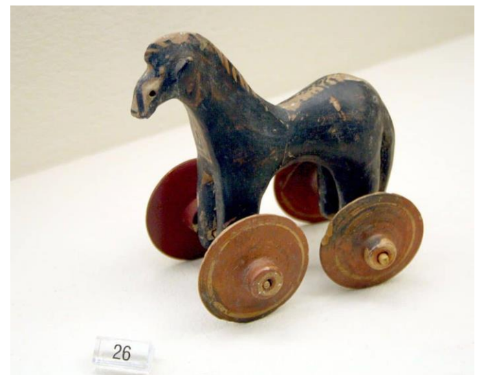
Άθυρμα (πήλινο αλογάκι πάνω σε ρόδες)

Στην αρχαία Ελλάδα η λέξη «άθυρμα» συνδέεται με το ρήμα «αθύρω» το οποίο σημαίνει «παίζω». Στον Πλάτωνα και στον Αριστοφάνη γίνονται αναφορές στη φύση, στα χαρακτηριστικά και στη σημασία του παιχνιδιού. Το «άθυρμα» ήταν ένα πήλινο αλογάκι πάνω σε ρόδες, το οποίο τα παιδιά έσερναν σε όλο το σπίτι. Το έπαιζαν και τα αγόρια και τα κορίτσια.