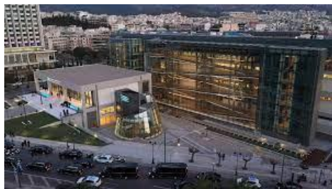
Το σύγχρονο κτήριο της Εθνικής Πινακοθήκης