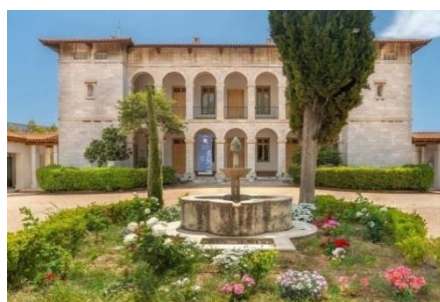
Βυζαντινό και Χριστιανικό Μουσείο

Ενδιαφέροντα είναι τα έργα από την εποχή των πρώτων χριστιανών. Τέλος, το μουσείο έχει και ένα πολύ ωραίο καφέ που σερβίρει ωραία ζεστή σοκολάτα.