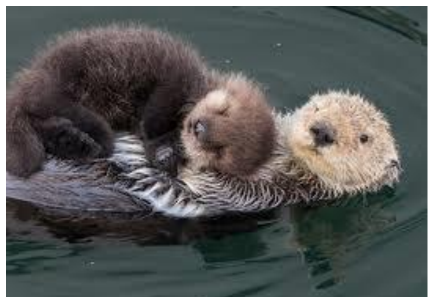
Ευρασιατική βίδρα, ένα ακόμα ζώο που ζει στη χώρα μας και απειλείται με εξαφάνιση

Η ευρασιατική βίδρα είναι ένα μικρόσωμο θηλαστικό το οποίο στη χώρα μας συναντιέται κυρίως στην Στερεά Ελλάδα και στην Εύβοια. Κατοικεί σε όχθες ποταμών και λιμνών με προϋπόθεση να είναι πολύ καθαρά τα νερά. Τρέφεται κυρίως με ψάρια, αλλά μπορεί να τραφεί και με νερόφιδα, πτηνά και με άλλα μικρά θηλαστικά. Απειλείται από την ρύπανση του νερού, την αποξήρανση και τον άνθρωπο. Οι βίδρες είναι πολύ γλυκά ζώακια, όταν κοιμούνται πιάνονται χέρι – χέρι.