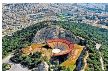
Το ιστορικό θέατρο του Λυκαβηττού άνοιξε φέτος και πάλι τις πύλες του στο κοινό

Ο Λυκαβηττός είναι ο λόφος που φαίνεται πάνω από το σχολείο μας. Από την πλευρά του σχολείου μας μπορούμε να ανέβουμε με το τελεφερίκ στο εκκλησάκι του Αγίου